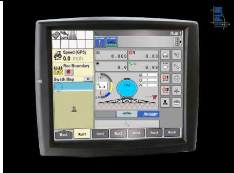
New Holland /Case IH