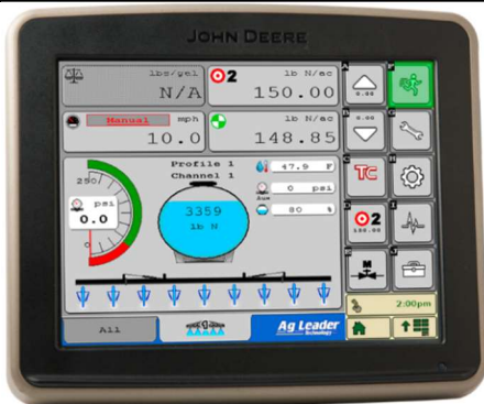
John Deere GreenStar